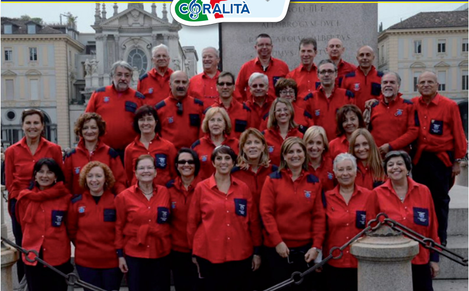
CORO C.A.I. di Frosinone ringrazia