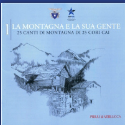
“La Montagna e la sua gente 1”