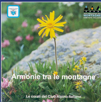
“ARMONIE TRA LE MONTAGNE”