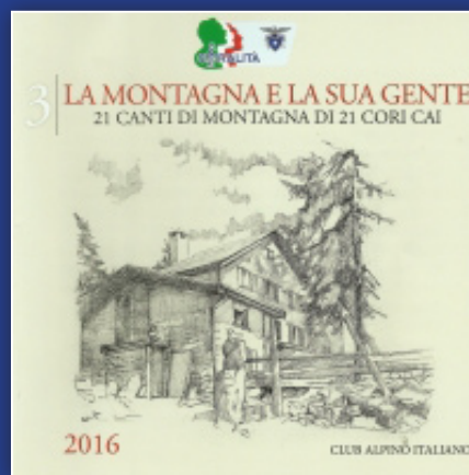
“La Montagna e la sua gente 3”